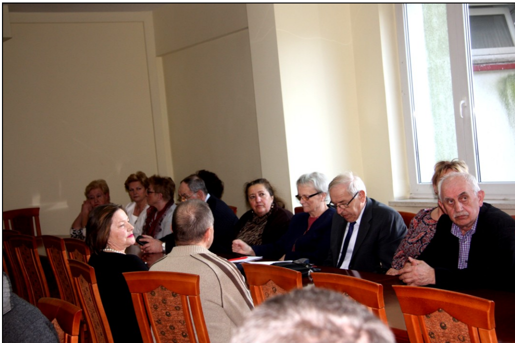
Il. 5. Słuchacze Uniwersytetu Trzeciego Wieku z Bobolic oraz przyjaciel koła – pplk rez. SG (pierwszy z prawej) podczas wystąpienia prezesa koła PZF.